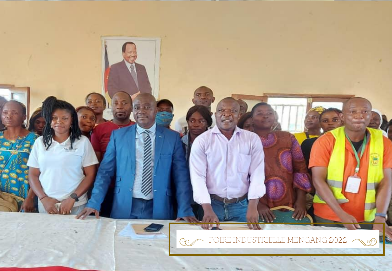
FOIRE INDUSTRIELLE MENGANG 2022